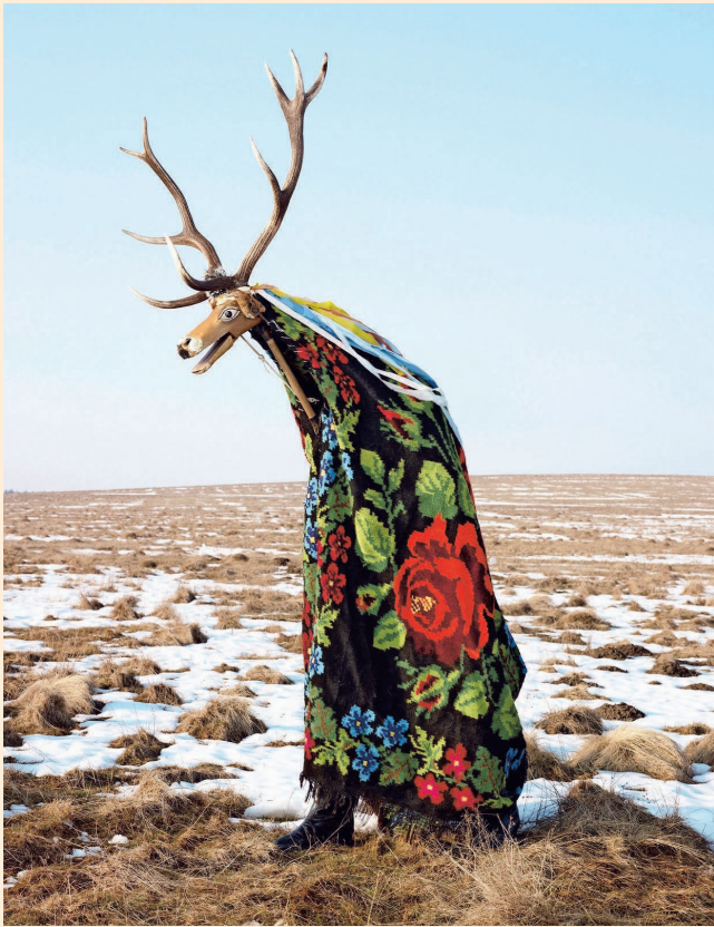
'Wilder Mann' van Charles Fréger. Met rituelen de angsten temmen.